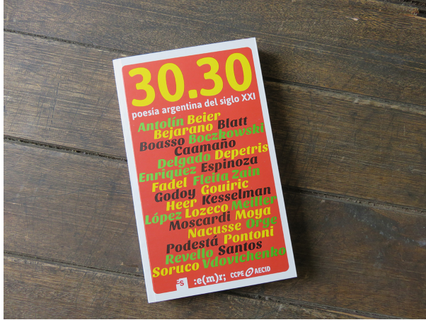
30.30 poesía argentina del siglo XXI (ES, EMR y CCPE/AECID, Rosario, 2013).