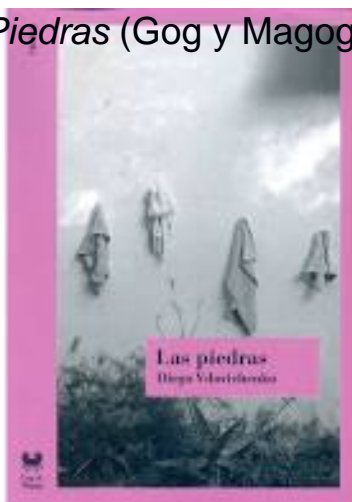
Las Piedras (Gog y Magog, Buenos Aires, 2015).