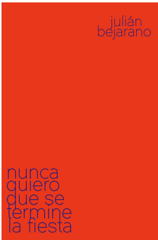
Nunca quiero que se termine la fiesta