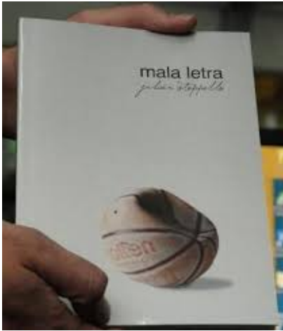
“Mala Letra” (La Hendija, 2012).