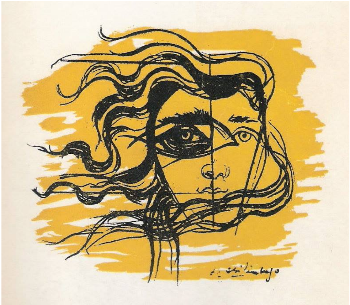
Obra de Spilimbergo para Emma de Cartosio, 1958.