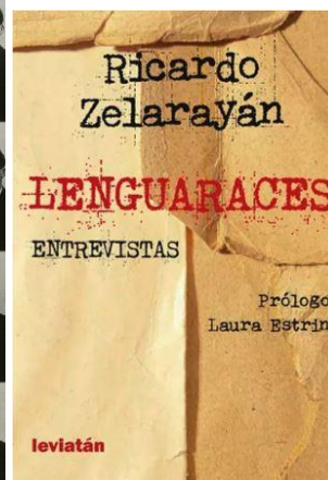
Lenguaraces Leviatan - 2024 Información Ver: Zelarayan escucha otras voces